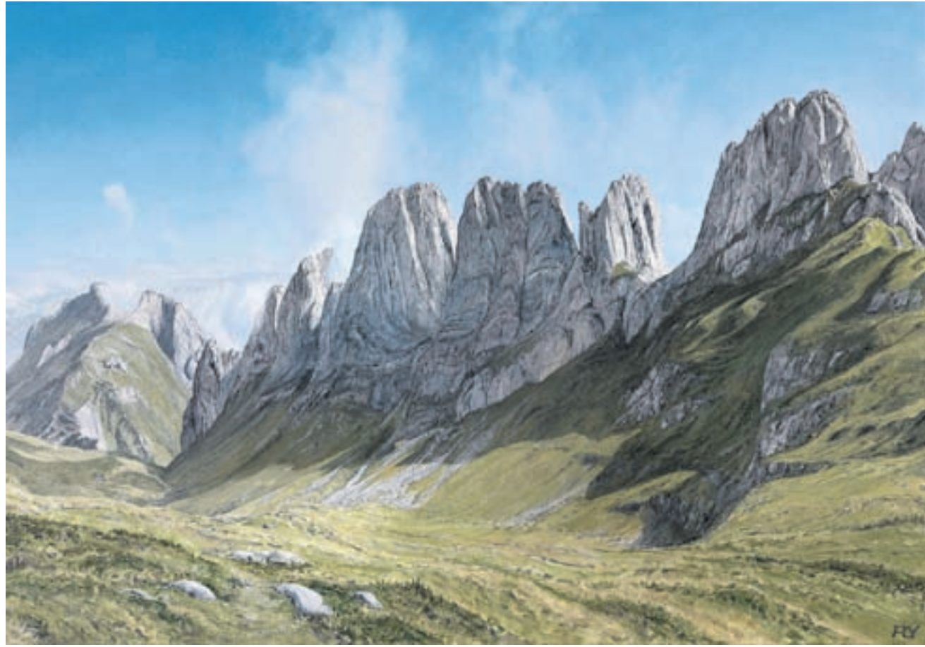
Ansichten eines Chemikers. Peter Young setzt die «Kreuzberge» in Öl um.

Die 18. Jahresausstellung der Gilde Schweizer Bergmaler in Appenzell